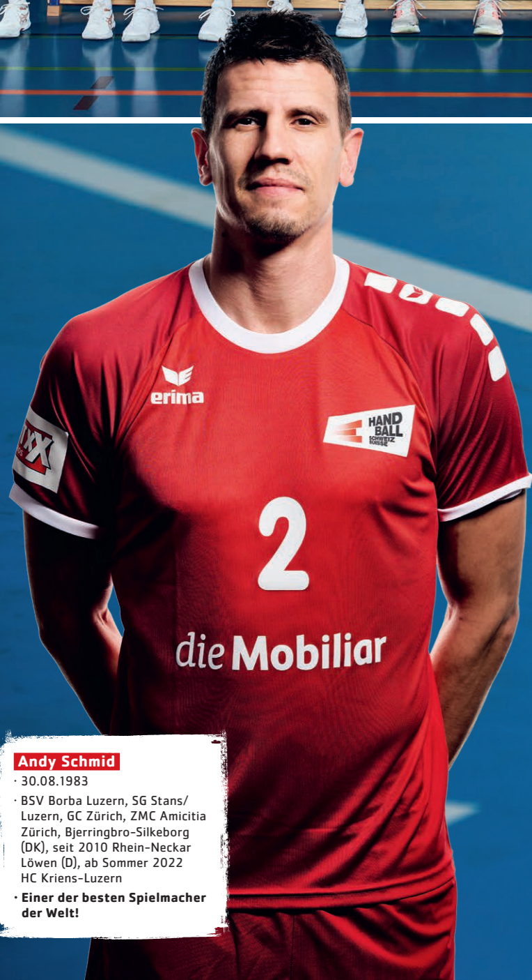
Andy Schmid • 30.08.1983 • BSV Borba Luzern, SG Stans/Luzern, GC Zürich, ZMC Amicitia Zürich, Bjerringbro-Silkeborg (DK), seit 2010 Rhein-Neckar Löwen (D), ab Sommer 2022 HC Kriens-Luzern • Einer der besten Spielmacher der Welt!